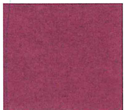
Lichtpaars gem. 432