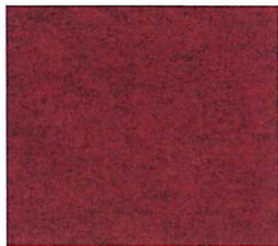
Donkerrood gem. 438