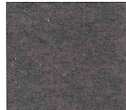
Donkergrijs gem. 494