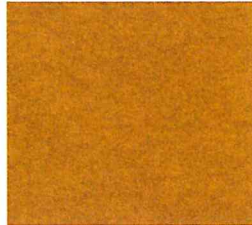
Okker gem. 424