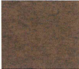
Taupe gem. 409