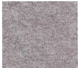
Middengrijs gem. 400