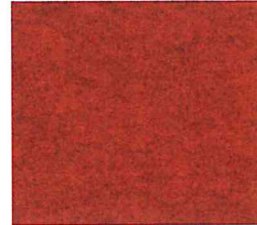
Roestrood gem. 426