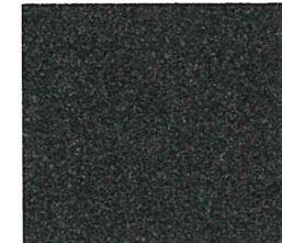
Antraciet gem. 496

Alle viltten in deze serie hebben de volgende eigenschappen: