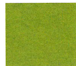
Limoengroen gem. 446