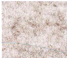
Lichtgrijs gem. 401