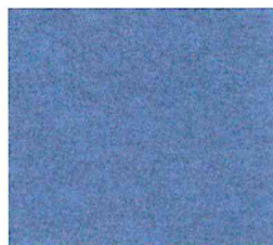
Ijsblauw gem. 450